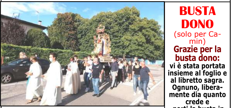
La processione dell'anno scorso breve e fatta solo dai diciottenni...

BUSTA DONO (solo per Camin) Grazie per la busta dono: vi è stata portata insieme al foglio e al libretto sagra. Ognuno, liberamente dia quanto crede e porti la busta in chiesa nei giorni della Sagra.